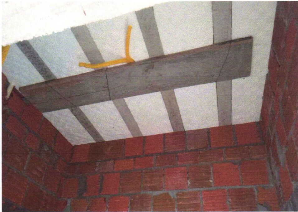
FOTO 09 – Laje pré-fabricada treliçada para piso ou cobertura, intereixo 38cm, h=12cm, el. enchimento em EPS h=8cm, inclusive escoramento em madeira e capeamento 4cm