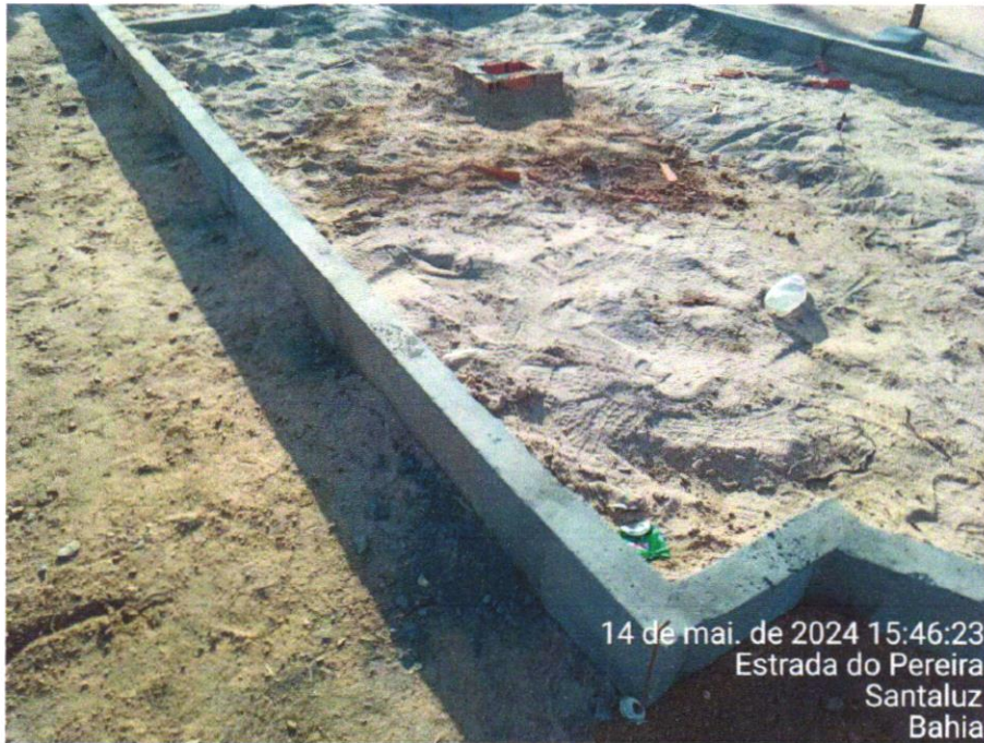
Foto 17 - GUIA (MEIO-FIO) CONCRETO, MOLDADA IN LOCO EM TRECHO RETO COM EXTRUSORA, 13 CM BASE X 22 CM ALTURA. AF_06/2016