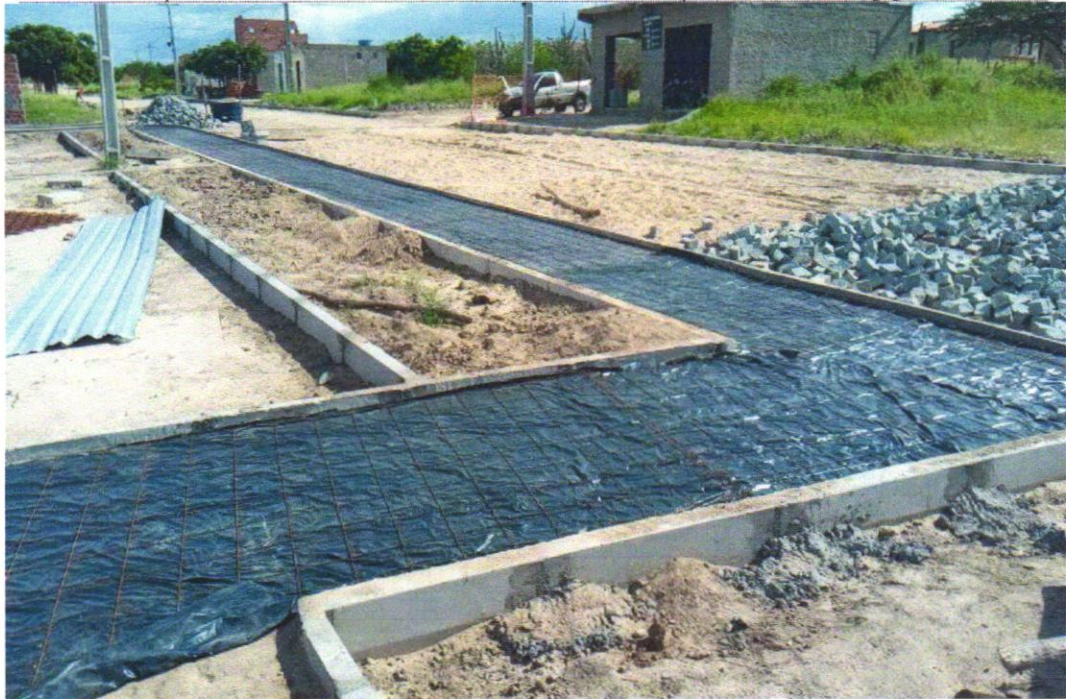
Foto 13 - Fornecimento e instalação de tela aço soldada nervurada CA-60, malha 15x15cm, ferro 4.2mm, painel 2x3m, (1,50kg/m 2 ), Malha Pop Reforçada Gerdau ou similar