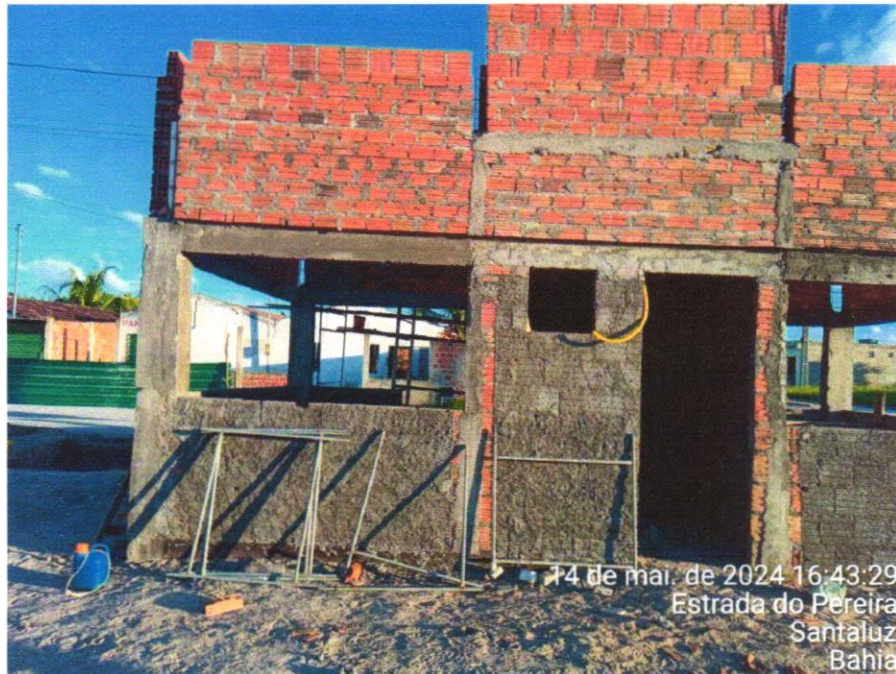
FOTO 07 – CHAPISCO APLICADO EM ALVENARIAS E ESTRUTURAS DE CONCRETO INTERNAS, COM COLHER DE PEDREIRO. ARGAMASSA TRAÇO 1:3 COM PREPARO EM BETONEIRA 400L. AF_10/2022