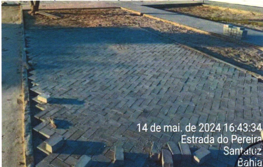
Foto 14 - EXECUÇÃO DE PASSEIO EM PISO INTERTRAVADO, COM BLOCO RETANGULAR COLORIDO DE 20 X 10 CM, ESPESSURA 6 CM. AF_10/2022

Tommy F. Afonso 13 749 775/0001-0 13 749 775/0001-0 13 749 775/0001-0