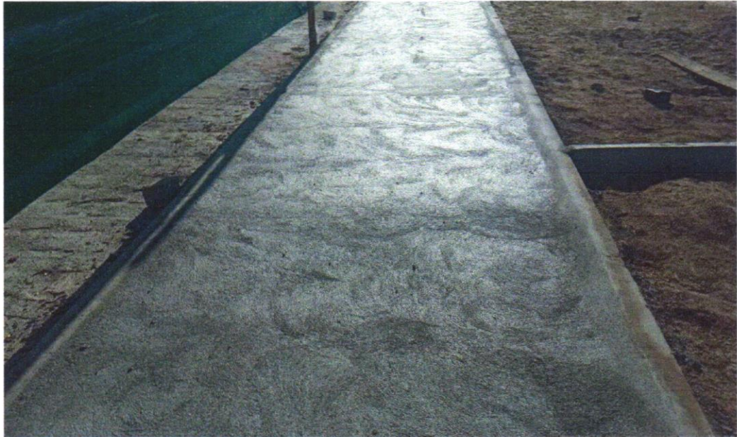
Foto 21 – CONTRAPISO EM ARGAMASSA TRAÇO 1:4 (CIMENTO E AREIA), PREPARO MANUAL, APLICADO EM ÁREAS MOLHADAS SOBRE IMPERMEABILIZAÇÃO, ACABAMENTO NÃO REFORÇADO, ESPESSURA 4CM. AF_07/2021