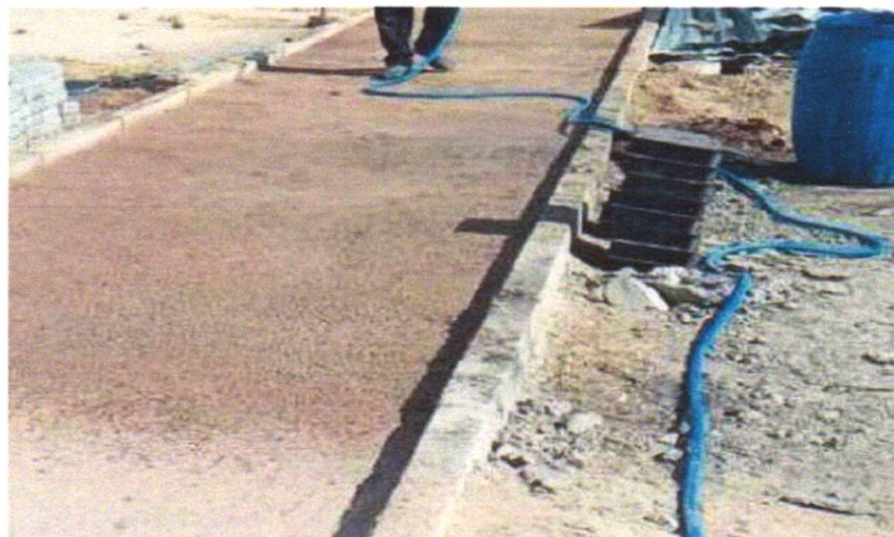
FOTO 01 – REGULARIZAÇÃO E COMPACTAÇÃO DE SUBLEITO DE SOLO PREDOMINANTEMENTE ARENOSO. AF_11/2019