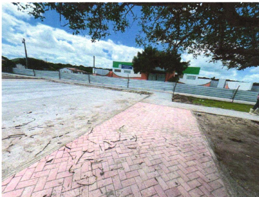
Foto 15 - EXECUÇÃO DE PASSEIO EM PISO INTERTRAVADO, COM BLOCO RETANGULAR COLORIDO DE 20 X 10 CM, ESPESSURA 6 CM. AF_10/2022