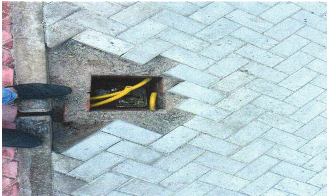
Foto 19 - Caixa de passagem 30x30cm em chapa de aço galvanizado – fornecimento