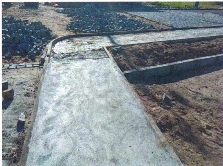
Foto 12 - CONTRAPISO EM ARGAMASSA TRAÇO 1:4 (CIMENTO E AREIA), PREPARO MANUAL, APLICADO EM ÁREAS MOLHADAS SOBRE IMPERMEABILIZAÇÃO, ACABAMENTO NÃO REFORÇADO, ESPESSURA 4CM. AF_07/2021