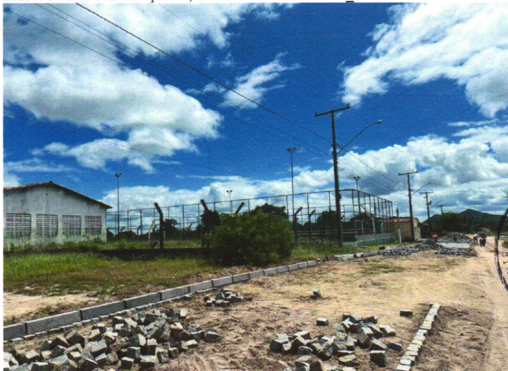
Foto 22 - REGULARIZAÇÃO E COMPACTAÇÃO DE SUBLEITO DE SOLO PREDOMINANTEMENTE ARENOSO. AF_11/2019

Wendel Simões Cruz 13 749.775/0001-00 SANTO ANTONIO DO ARAUJO LTDA RUA HILTON LOPES, 806 - Centro 13200-000 - Santa Luz - SP