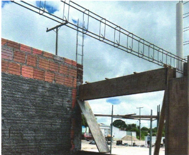
FOTO 03 - VERGA PRÉ-MOLDADA PARA JANELAS COM ATÉ 1,5 M DE VÃO. AF_03/2016