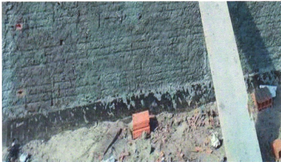
Foto 11 - IMPERMEABILIZAÇÃO DE SUPERFÍCIE COM EMULSÃO ASFÁLTICA, 2 DEMÃOS AF_06/2018