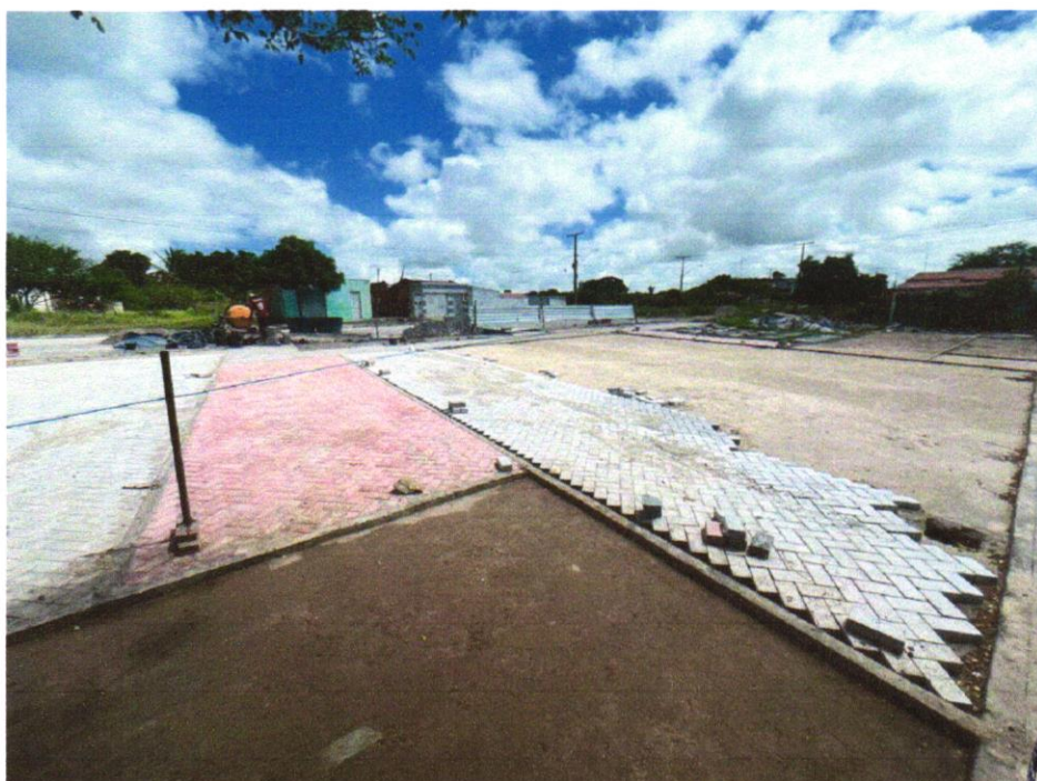
Foto 16 - EXECUÇÃO DE PASSEIO EM PISO INTERTRAVADO, COM BLOCO RETANGULAR COLORIDO DE 20 X 10 CM, ESPESSURA 6 CM. AF_10/2022