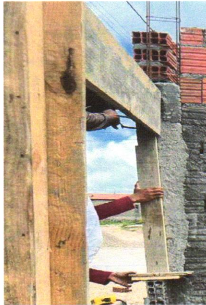
FOTO 05 – VERGA PRÉ-MOLDADA PARA PORTAS COM ATÉ 1,5 M DE VÃO. AF_03/2016