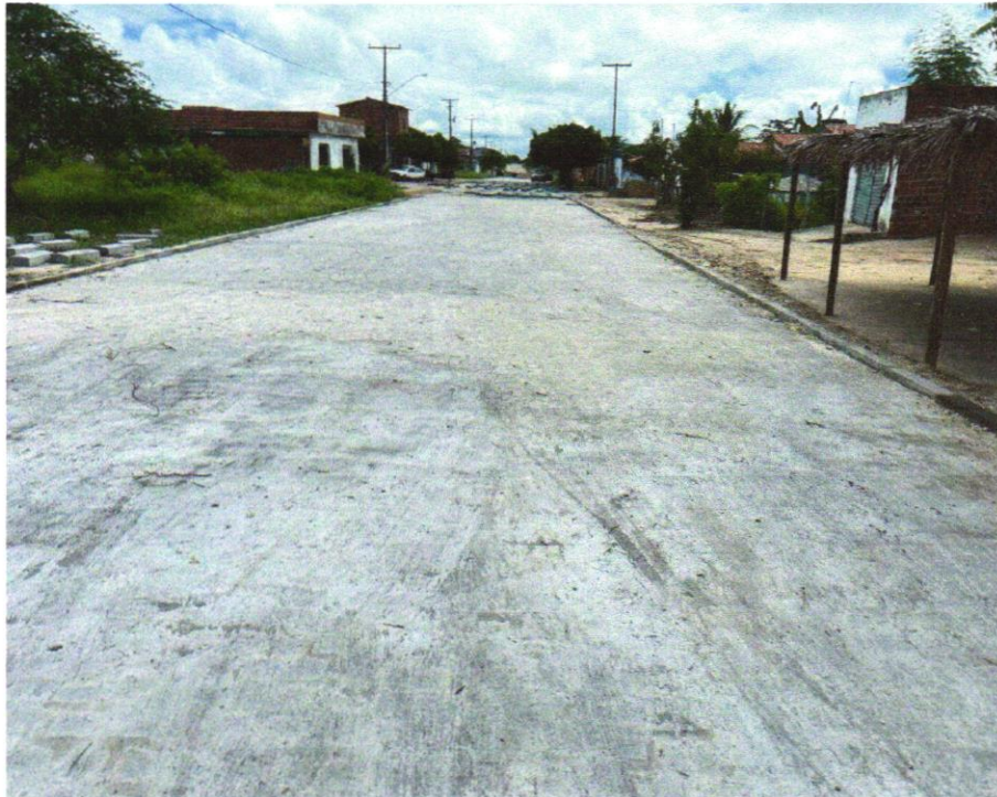
Foto 23 - EXECUÇÃO DE PAVIMENTO EM PARALELEPÍPEDOS, REJUNTAMENTO COM ARGAMASSA TRAÇO 1:3 (CIMENTO E AREIA). AF_05/2020