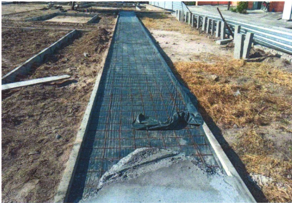
Foto 25 - APLICAÇÃO DE LONA PLÁSTICA PARA EXECUÇÃO DE PAVIMENTOS DE CONCRETO. AF_04/2022