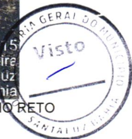
Foto 18 - GUIA (MEIO-FIO) CONCRETO, MOLDADA IN LOCO EM TRECHO RETO COM EXTRUSORA, 13 CM BASE X 22 CM ALTURA. AF_06/2016

Wendel Simões Cruz 13.749.775/0001 AV. SANGENHANA LTDA RUA INDUSTRIAL PEREIRA, 805 - Graças CEP: 45.854-100 - Salvador - Bahia