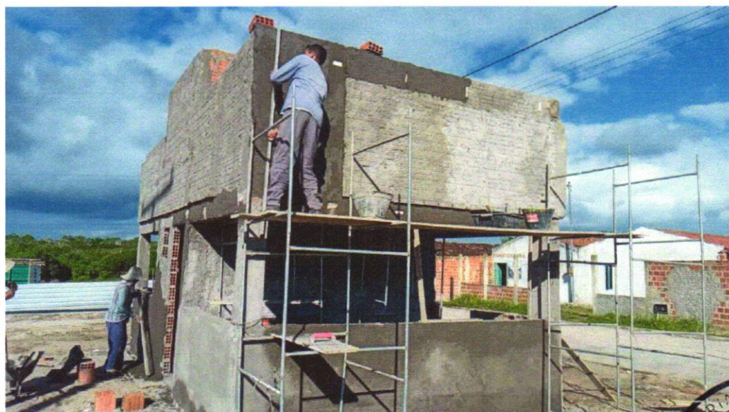
FOTO 08 – MASSA ÚNICA, PARA RECEBIMENTO DE PINTURA OU CERÂMICA. ARGAMASSA INDUSTRIALIZADA, PREPARO MECÂNICO, APLICADO COM EQUIPAMENTO DE MISTURA E PROJEÇÃO DE 1,5 M3/H EM FACES INTERNAS DE PAREDES, ESPESSURA DE 5MM, SEM EXECUÇÃO DE TALISCAS. AF_08/2014