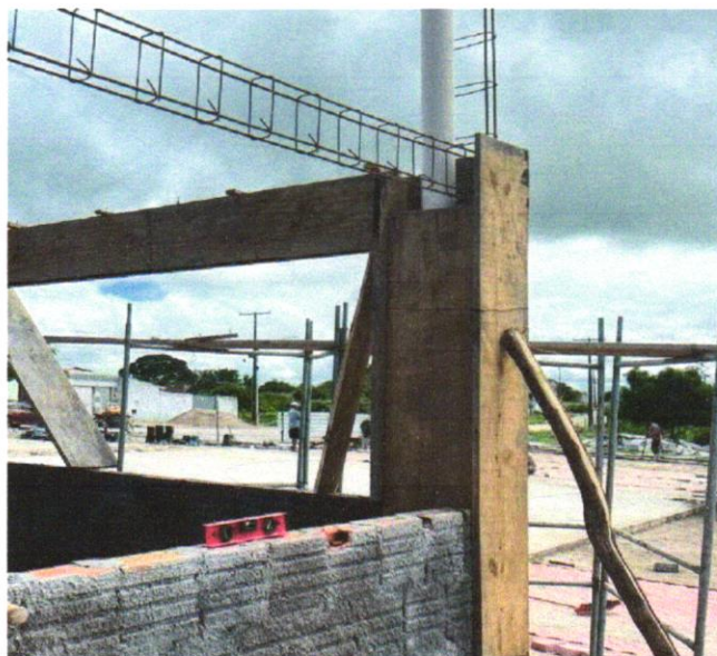
FOTO 02 – (COMPOSIÇÃO REPRESENTATIVA) EXECUÇÃO DE ESTRUTURAS DE CONCRETO ARMADO, PARA EDIFICAÇÃO HABITACIONAL UNIFAMILIAR TÉRREA (CASA EM EMPREENDIMENTOS), FCK = 25 MPA. AF_01/2017

Wendel Simões Graf 13 749.775/0001 ANO 4 ENGENHARIA LTDA Rua Municipalidade, 805 - Goiás CEP 74.210-000 - Goiânia - GO